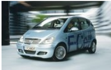
Links: Daimler F-Cell

Es laufen ja auch bereits Versuchsfahrzeuge mit HY-80 Brennstoffzellen-Systemen von Nucellsys, so z.B. in 60 Daimler F-Cell-Fahrzeugen sowie in Ford Focus FCV - Fahrzeugen.