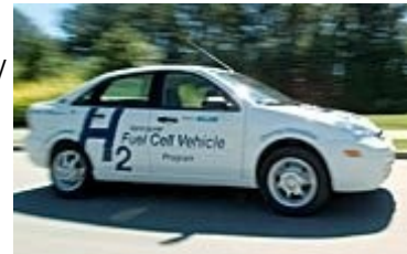
Rechts: Ford Focus FCV